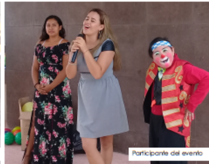
Participante del evento