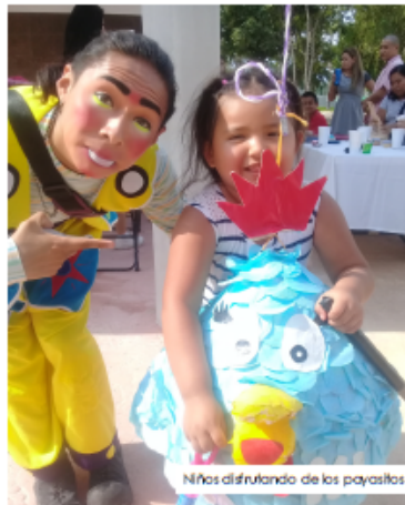
Niños disfrutando de los payasitos