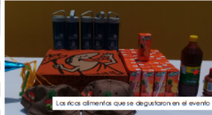
Las ricas almentas que se degustaron en el evento