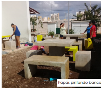
Papás pintando bancas