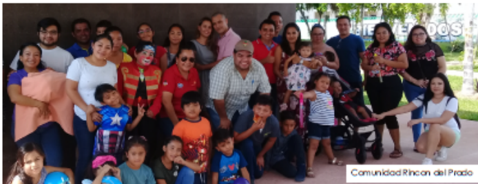
Comunidad Rincón del Prado

Organización vecinal felicita y agradece el apoyo de todos los propietarios que participaron y apartaron mano de obra y especie para poder llevar acabo el "Día del Niño", es grato ver el compromiso de todos los propietarios y vecinos de la sm. 260 mza. 8 CHOCH ¡FELICIDADES! su apoyo es y será siempre fundamental para lograr un objetivo, por ultimo a GRUPO SADASI quien festejo a todas las mamicas en su día. ¡MUCHAS GRACIAS!