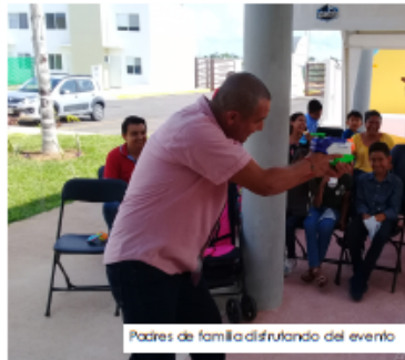
Padres de familia disfrutando del evento